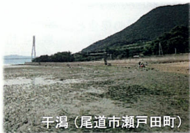
干潟 (尾道市瀬戸田町)