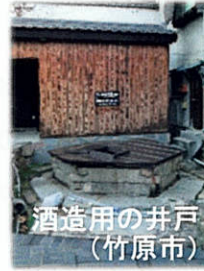
酒造用の井戸 (竹原市)