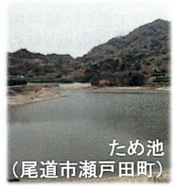
ため池 (尾道市瀬戸田町)